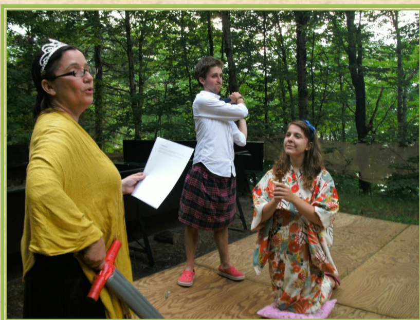
Couronnement de Fry 1 re et abdication de Douc 1 er