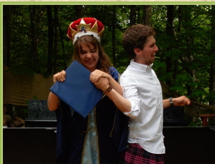
Le Prince Consort Douc résiste à la passation des pouvoirs.