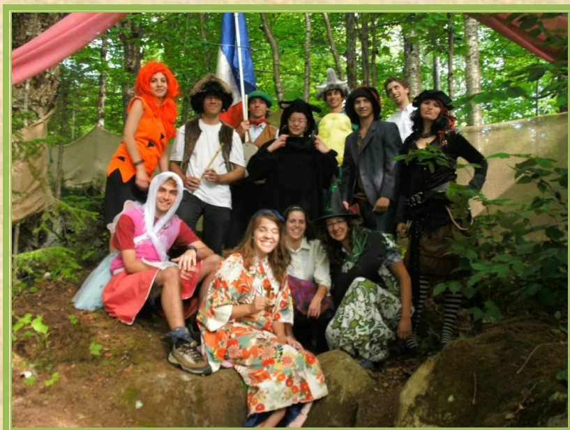
Bienvenue au village du Royaume de Septilie !